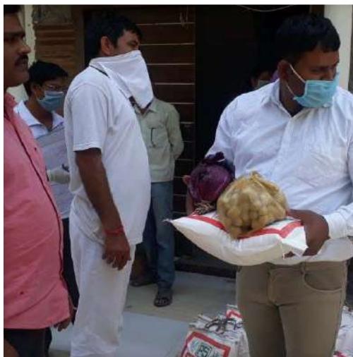
Dry Ration Distribution at Kayampur Village Greater Noida

Non-Perishable food packets (comprising of 5 Kg Flour, Salt, Biscuits, Spices and Potato) distributed to 150 families in Kayampur village, Greater Noida