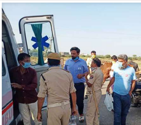
Sanitizer & Mask Distribution at Bharuch

In addition, sanitization of 4 villages in the vicinity of our manufacturing facility at Savli has been undertaken. Awareness was also done within the community throughout the sanitization process.