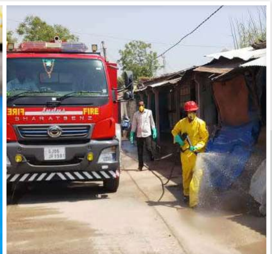
Sanitization of a Village in Progress