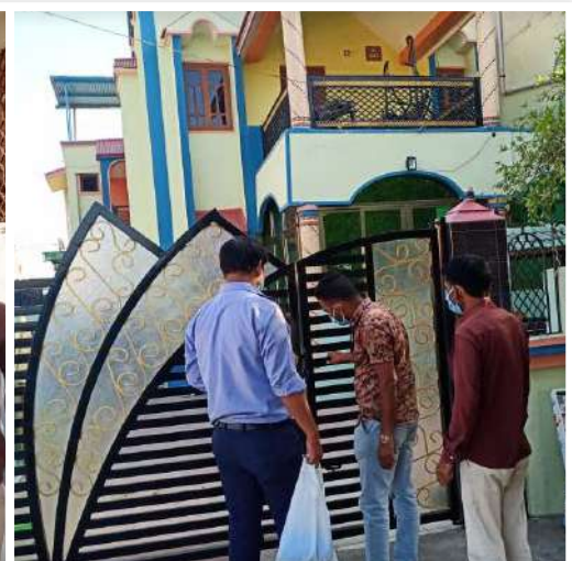
Masks, Soaps and Sanitizers Distributed among the Community at Bharuch