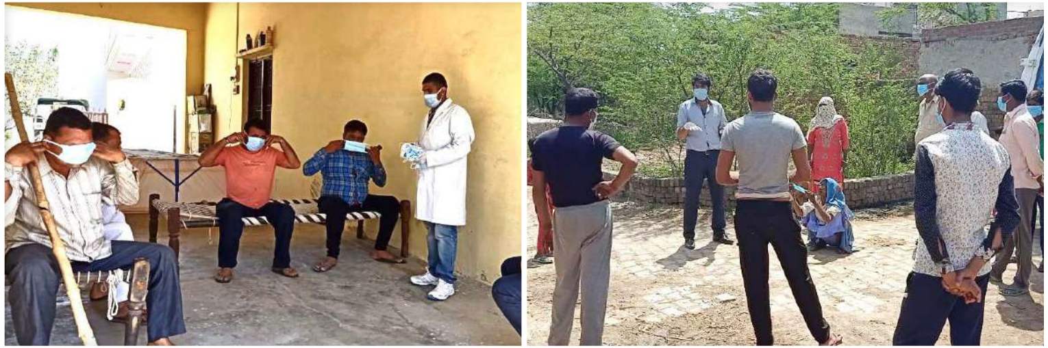
COVID-19 Awareness Camp at Kukdola, Jhajjar

During this critical situation, the Government official, local administration, healthcare workers, police personnel and other essential services are providing a great service to the nation by being on the frontlines of this pandemic. Understanding their safety is paramount Jubilant has supported the local administration by facilitating the distribution of masks, sanitizers etc at various locations across the country.