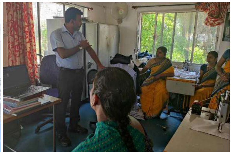
Generating Awareness on COVID-19 in Women Self Help Groups