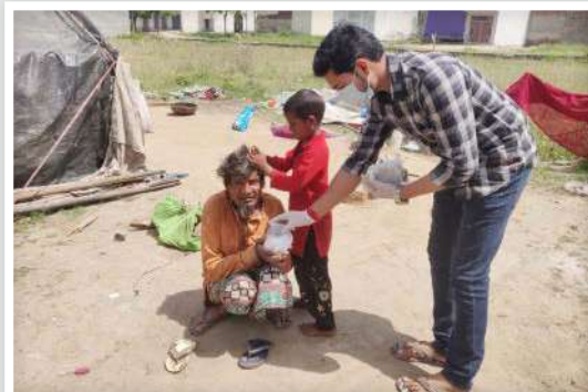
Meal Support for Underprivileged at Gajraula