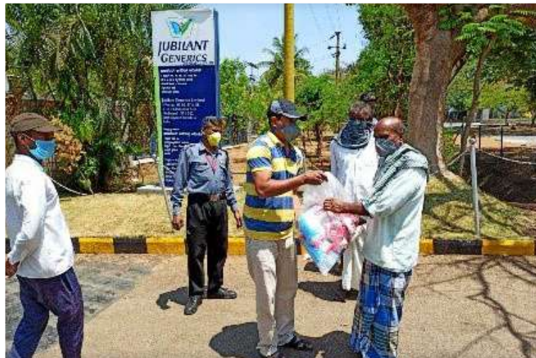
Grocery and Essential Item Distribution