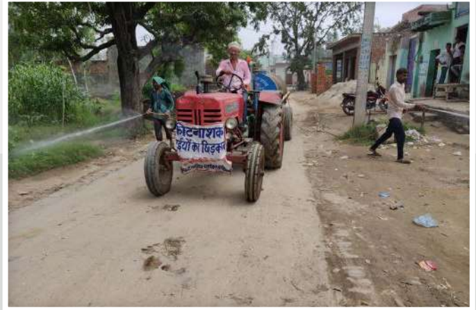
Village Sanitization Work Done in Gajraula

A team from JBF was sent out to conduct sanitization procedures across Gajraula. 4 major villages that we covered were Basaili, Shahbajpur Dor, Naipura and Moharka.