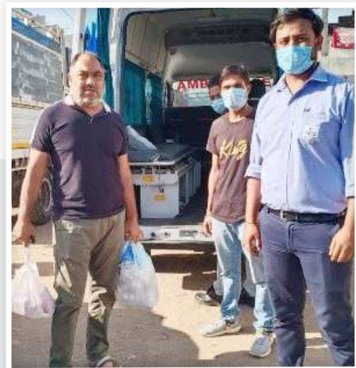
Support Initiative at Bharuch

Different parts of the world are being deeply impacted by the COVID-19 outbreak currently. While the entire world has been caught off guard, the progression of the disease cannot be predicted yet. It is imperative now that we all come together in this hour of crisis to help and support one another. Our support and pro-activeness will be extremely critical in determining our future. With the promise of Caring, Sharing, Growing, the Jubilant Bhartia Foundation (JBF) has been doing community work in the last three weeks in the areas of health & safety, food, sanitization, communication and closely working with the local administration among others.