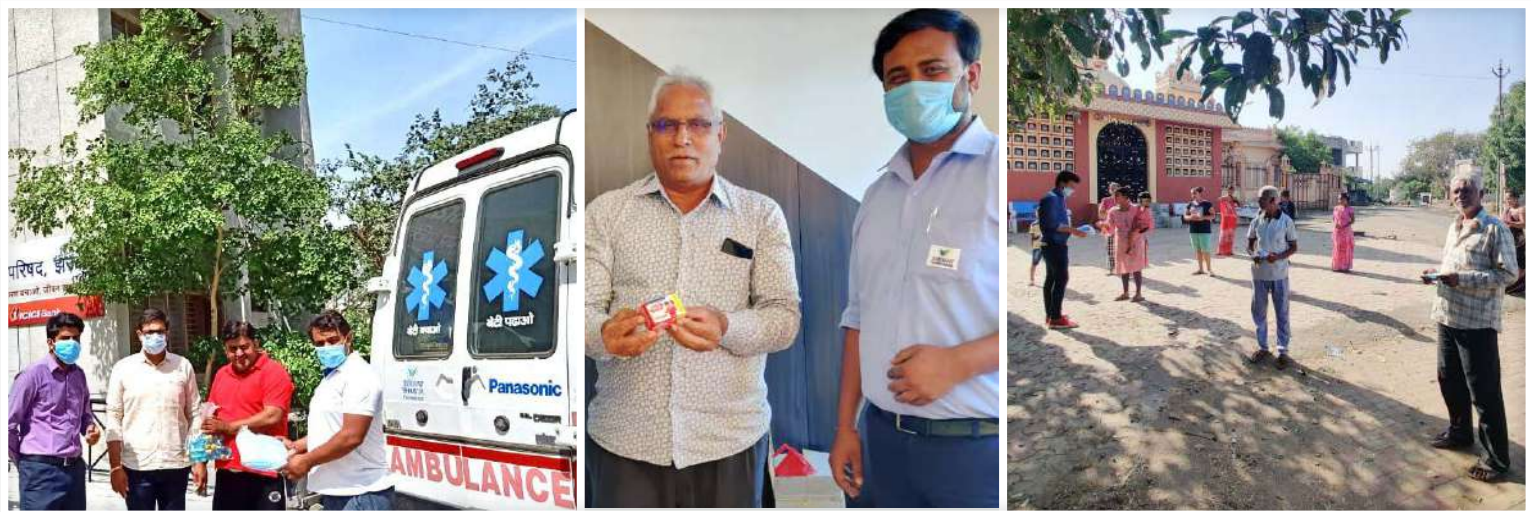
Mask, Soap and Sanitizer Distribution

Masks ( over 15,000 ), sanitizers ( over 2500 L ) and soaps have been distributed free of cost in the community around our various facilities across India.