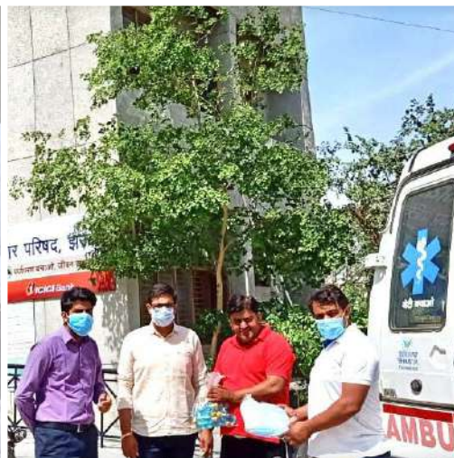
Mask and Sanitizer Distribution at Jhajjar