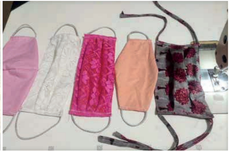
Masks Stitched by a JBF Initiated SHG