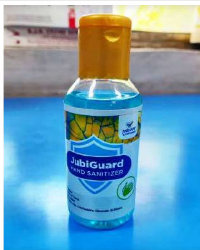
Hand Sanitizer Manufactured at Jubilant for Donation