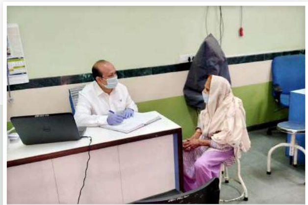
A Patient Consulting the Doctor at JBF Medical Centre

Participants of regular health camps of the JBF's healthcare projects in various villages were additionally screened along with providing them necessary information on the disease. These screenings acted as preventive health check-up for the community boosting their confidence.