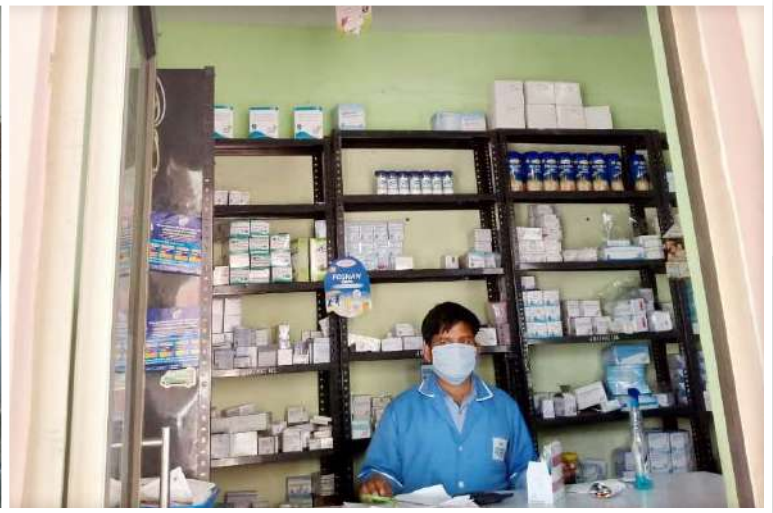
JBF Medical Centre remains Operational for Community