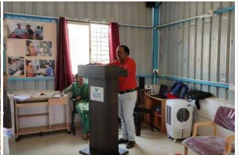
Awareness Sessions for the Youth