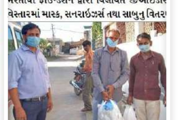
भरतिया फाउंडेशन द्वारा विलायत ज़ाओडीर वेस्टारभां मास्क, सनराइजसं तथा साधुन वितर