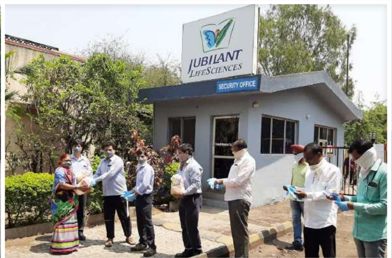
COVID-19 Support Initiatives at Nira