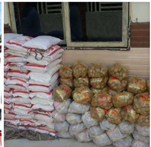
150 Packets of Dry Ration Distribution at Kayampur Village Greater Noida