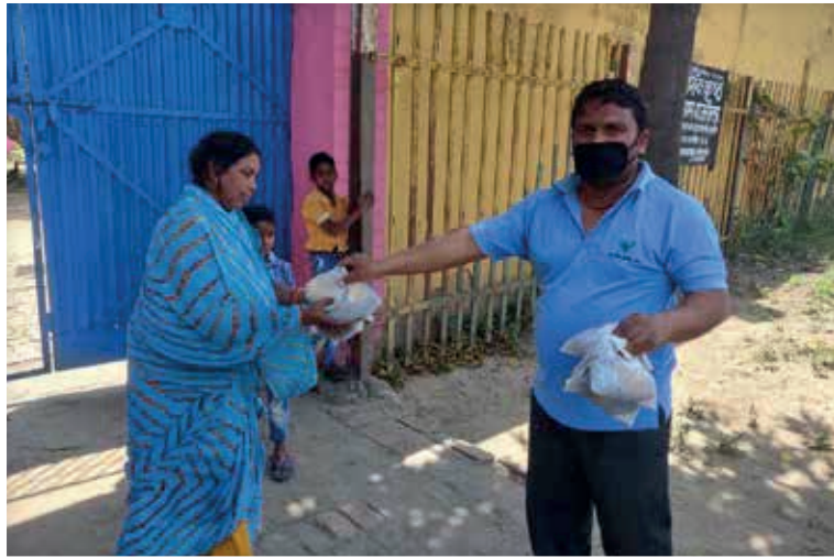
Helping Underprivileged with Meal Support