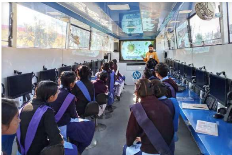
JBF Conducting COVID-19 Awareness Sessions for School Children

Several pro-active awareness workshops (over 50) have been organised at various locations around the company's facilities in India. These awareness workshops were organised within the community with the support of Sarpanchs and local administration, in the local language. The workshops quickly apprised villagers with necessary information on the outbreak of the disease and the precautions to curb its spread. Sessions about the significance of washing hands with soaps, usage of masks & sanitizers, how to maintain social distancing etc were undertaken. Important contact numbers for emergency were also shared with the community to build confidence. School children were educated about COVID-19 through video sessions. The CSR coordinators from the Jubilant Bhartia Foundation team acted as community's contact person for any COVID 19 related requirements within the community. The coordinators immediately helped individuals in need of support and kept themselves abreast about real-time situation at the grass-root level. Pamphlets in local language on COVID-19 awareness were also distributed in communities around our facility.