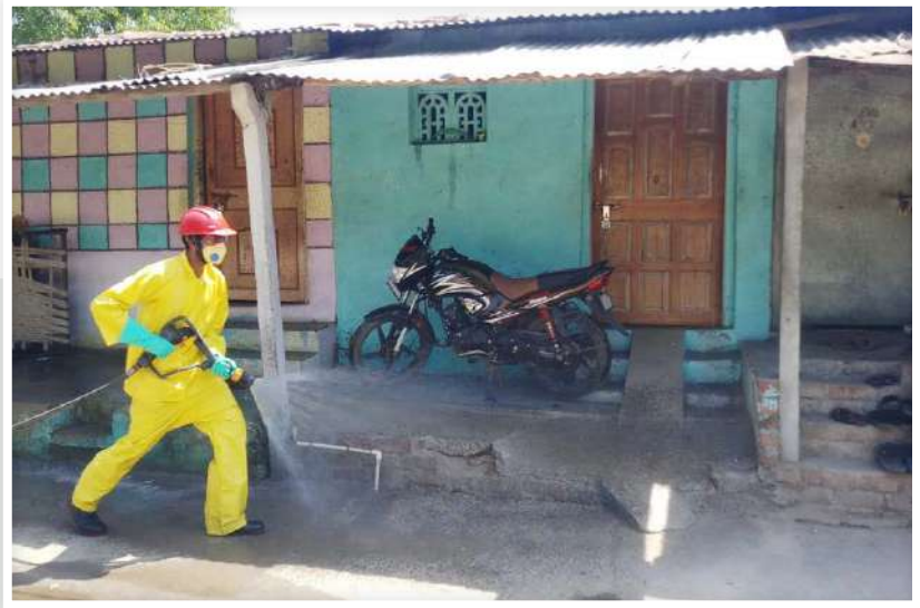
Sanitization of a Village in Progress