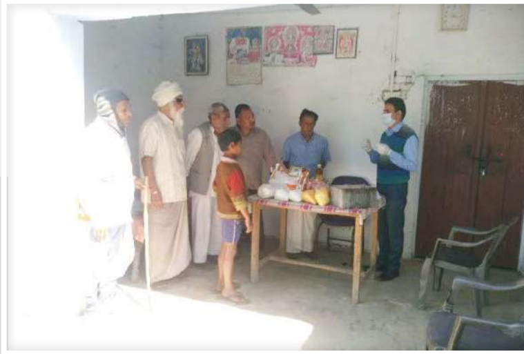
Supporting Old Age Home with Grocery