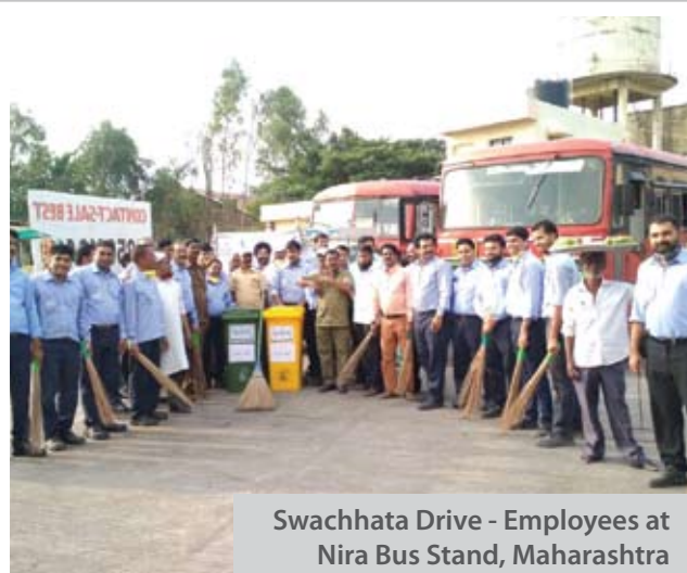
Swachhata Drive - Employees at Nira Bus Stand, Maharashtra