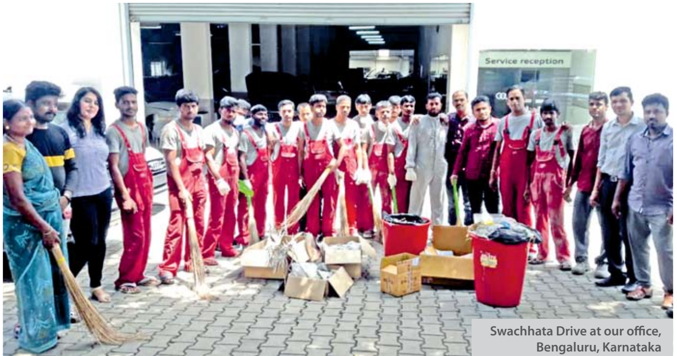
Swachhata Drive at our office, Bengaluru, Karnataka