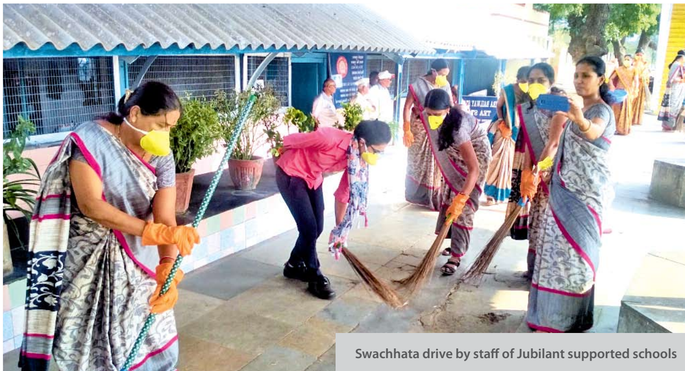
Swachhata drive by staff of Jubilant supported schools