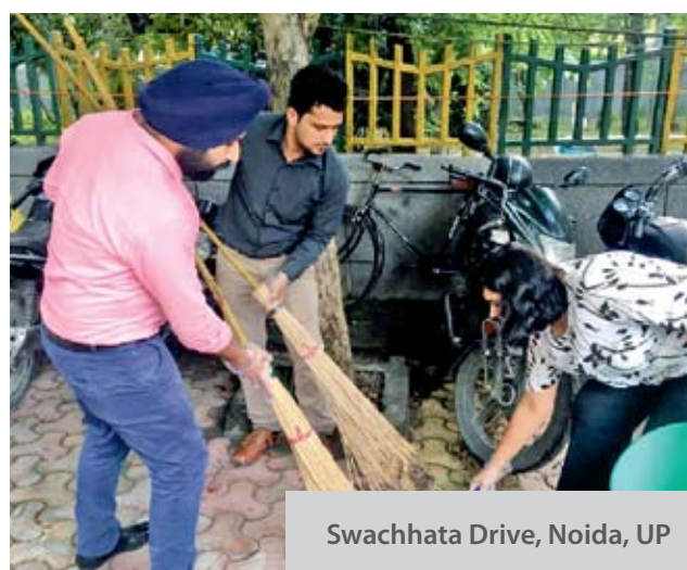
Swachhata Drive, Noida, UP