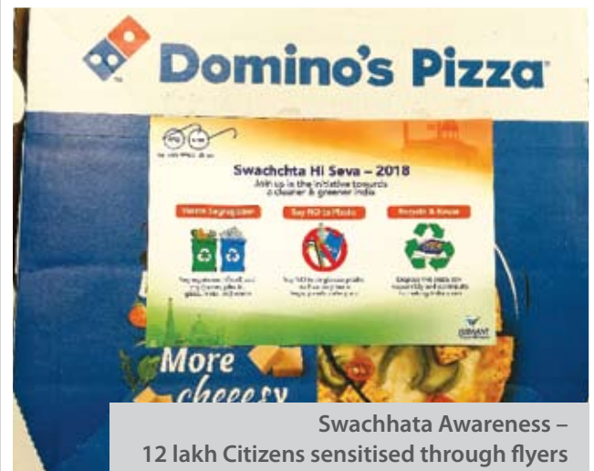
Swachhata Awareness – 12 lakh Citizens sensitised through flyers