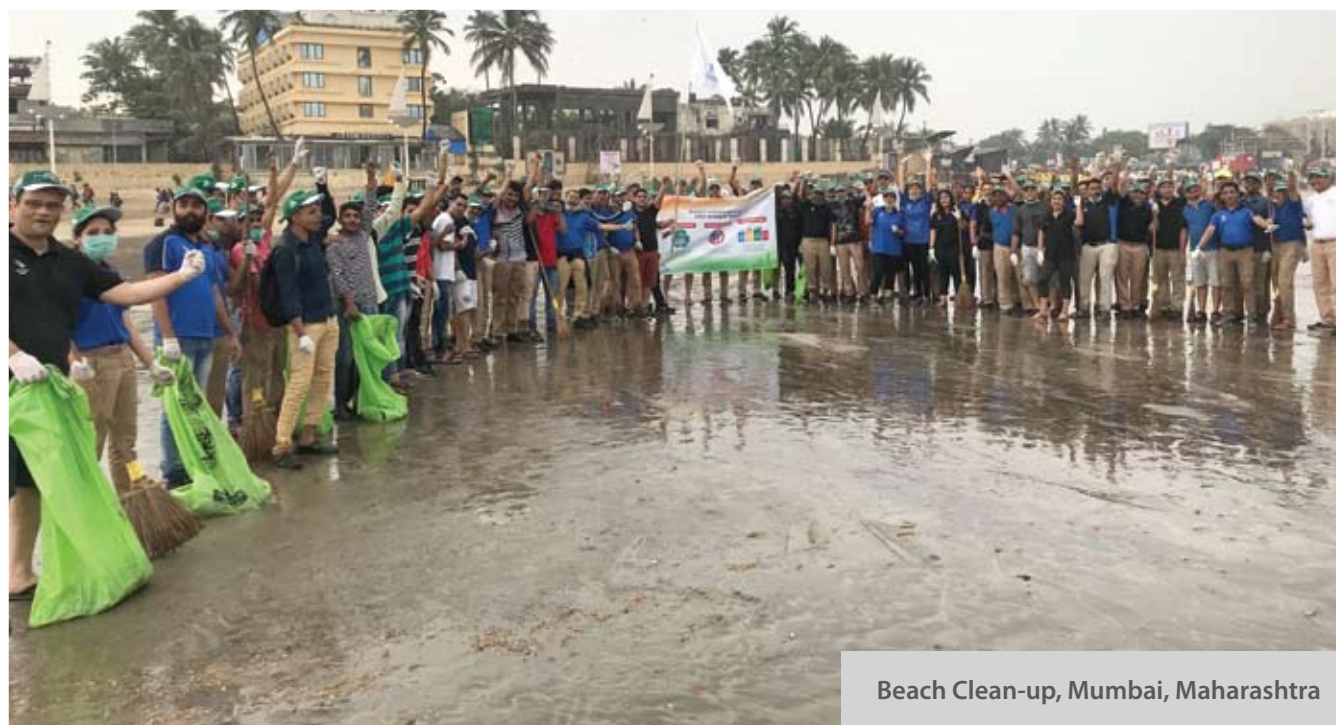
Beach Clean-up, Mumbai, Maharashtra