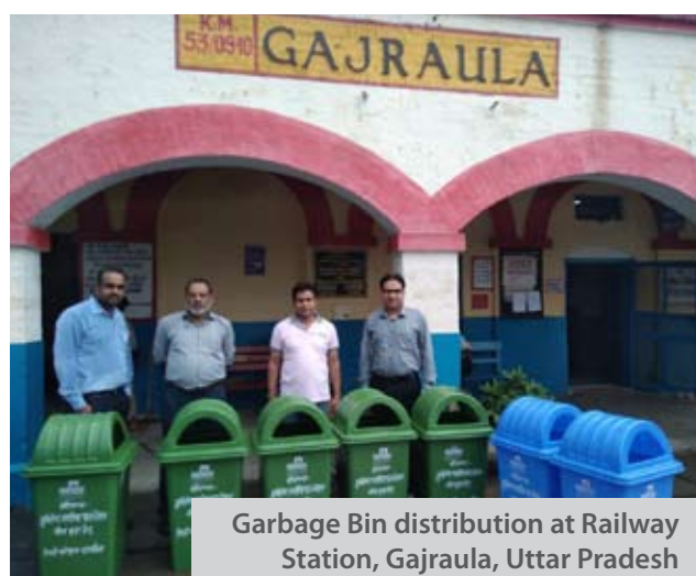
Garbage Bin distribution at Railway Station, Gajraula, Uttar Pradesh