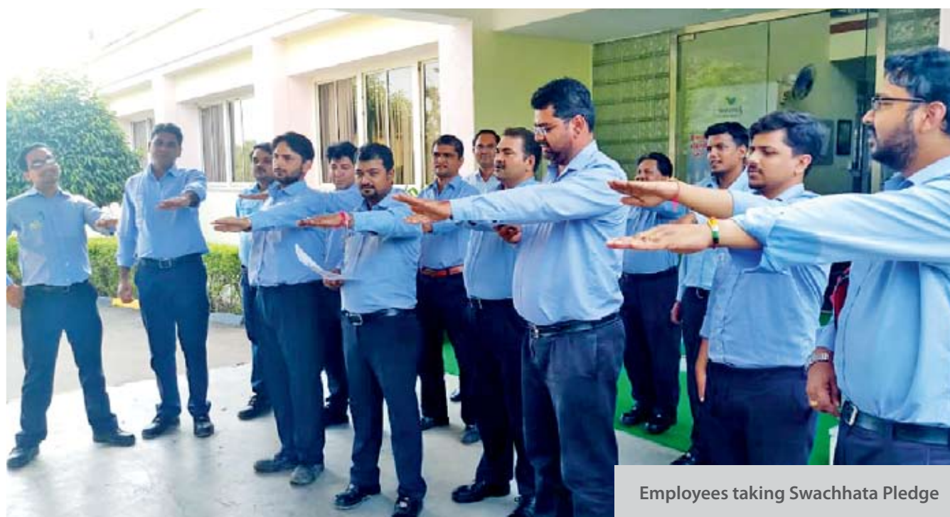
Employees taking Swachhata Pledge