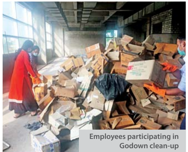
Employees participating in Godown clean-up