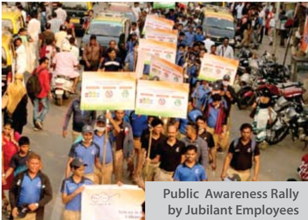
Public Awareness Rally by Jubilant Employees