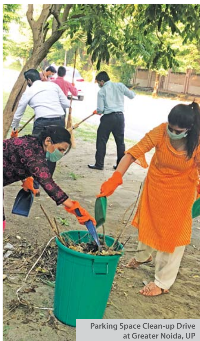
Parking Space Clean-up Drive at Greater Noida, UP