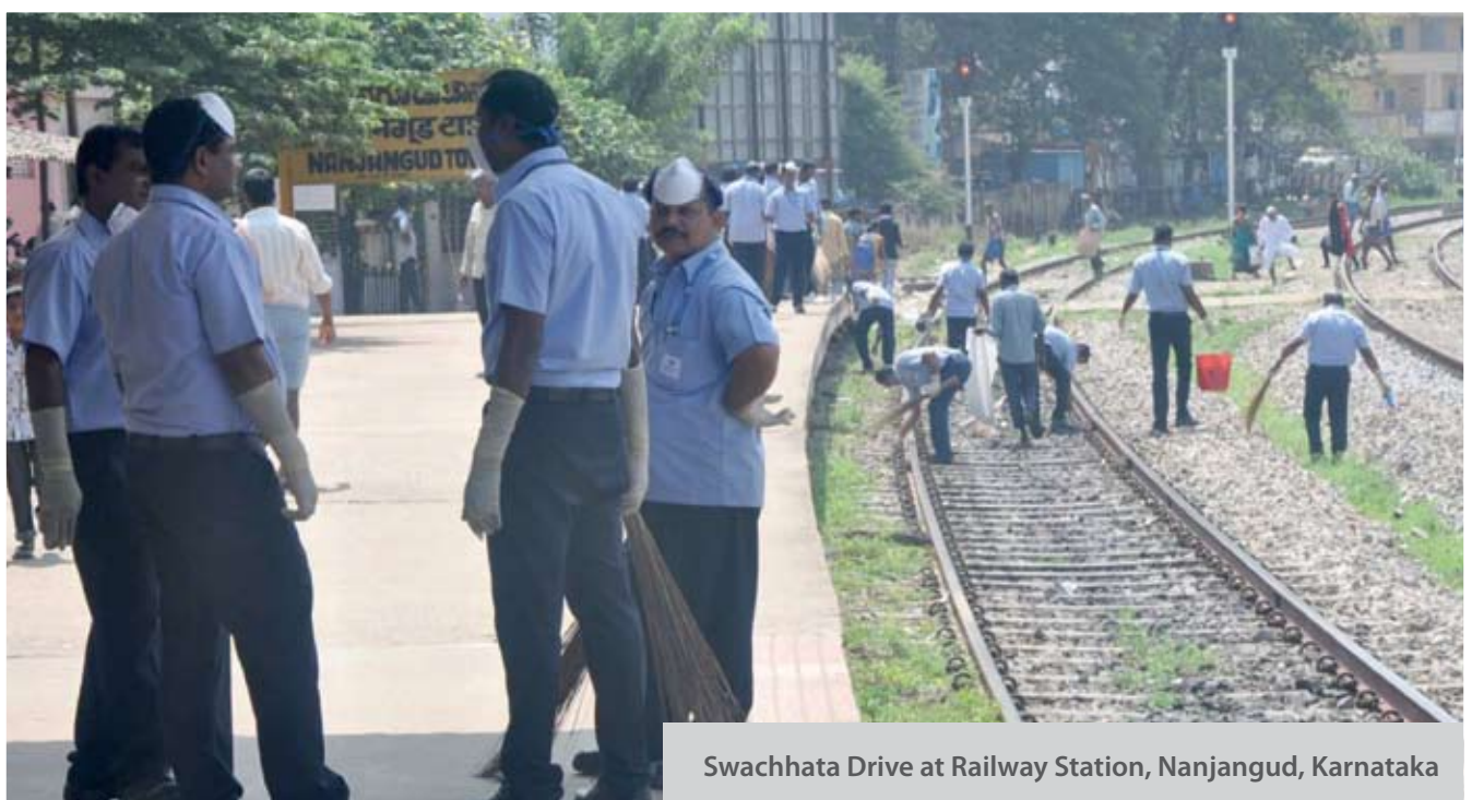
Swachhata Drive at Railway Station, Nanjangud, Karnataka