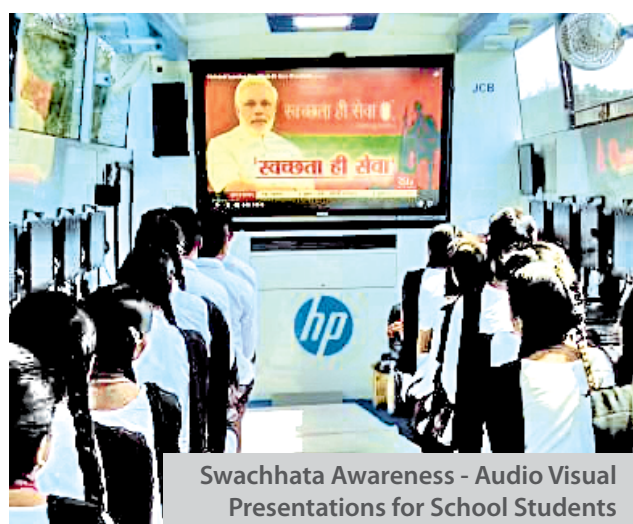
Swachhata Awareness - Audio Visual Presentations for School Students