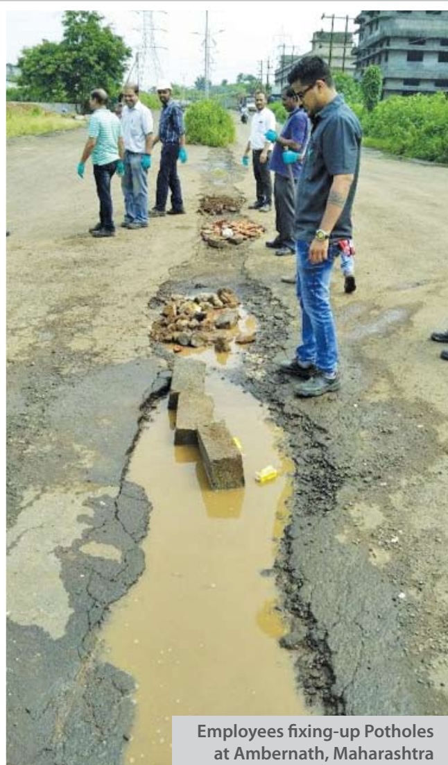
Employees fixing-up Potholes at Ambernath, Maharashtra