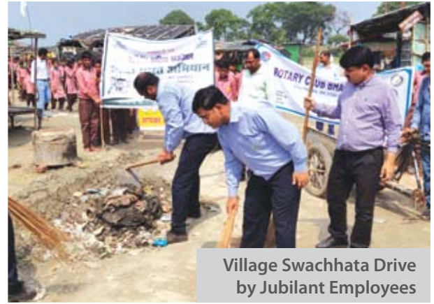
Village Swachhata Drive by Jubilant Employees