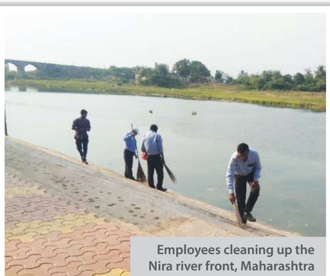
Employees cleaning up the Nira river front, Maharashtra