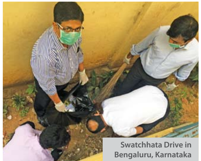
Swachhata Drive in Bengaluru, Karnataka