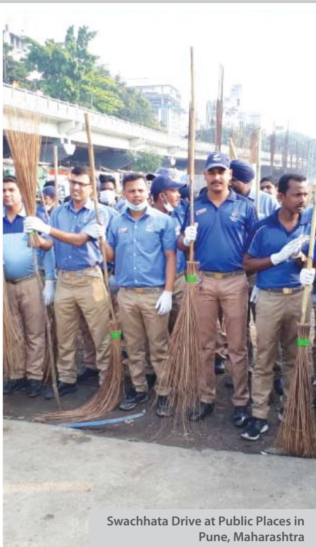
Swachhata Drive at Public Places in Pune, Maharashtra