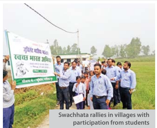
Swachhata rallies in villages with participation from students