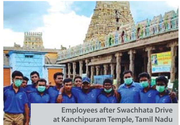
Employees after Swachhata Drive at Kanchipuram Temple, Tamil Nadu