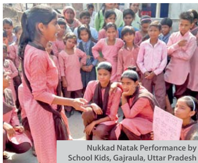
Nukkad Natak Performance by School Kids, Gajraula, Uttar Pradesh