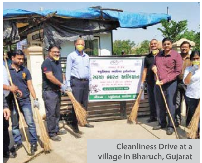
Cleanliness Drive at a village in Bharuch, Gujarat