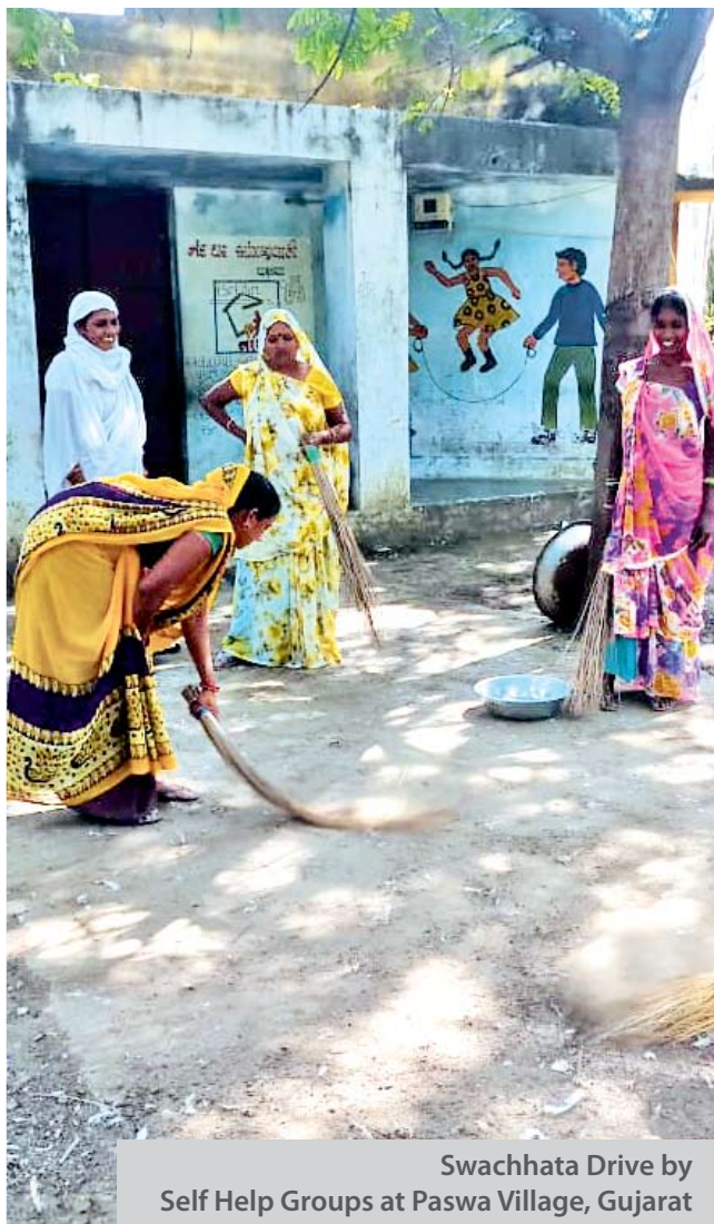
Swachhata Drive by Self Help Groups at Paswa Village, Gujarat