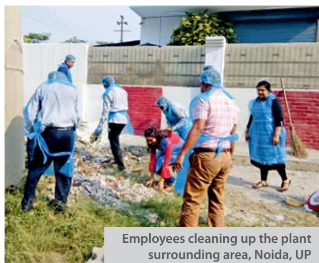
Employees cleaning up the plant surrounding area, Noida, UP