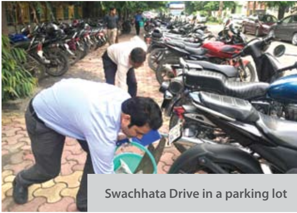
Swachhata Drive in a parking lot