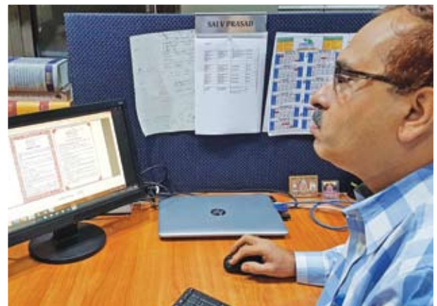
Employees taking Swachhata Pledge electronically