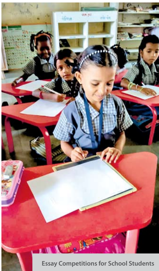
Essay Competitions for School Students