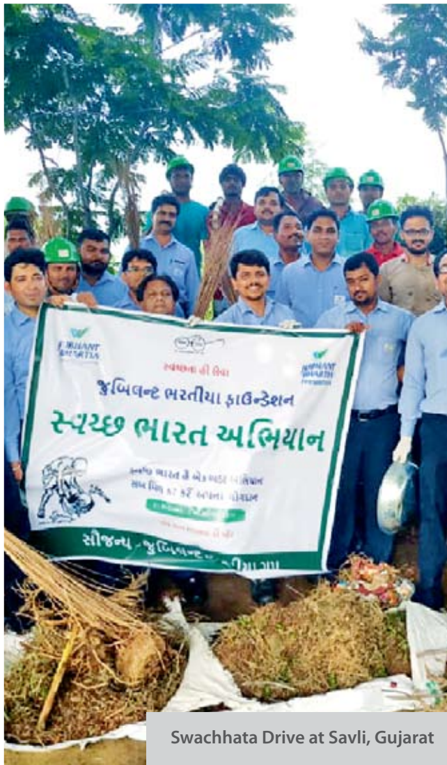
Swachhata Drive at Savli, Gujarat