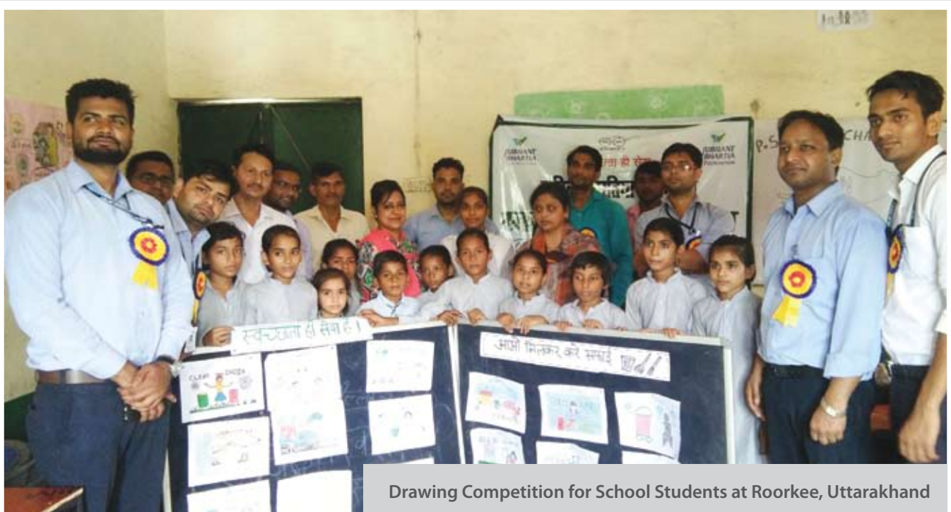
Drawing Competition for School Students at Roorkee, Uttarakhand